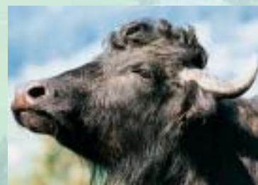
Wasserbüffel. Un arni (buffle). Water buffalo.