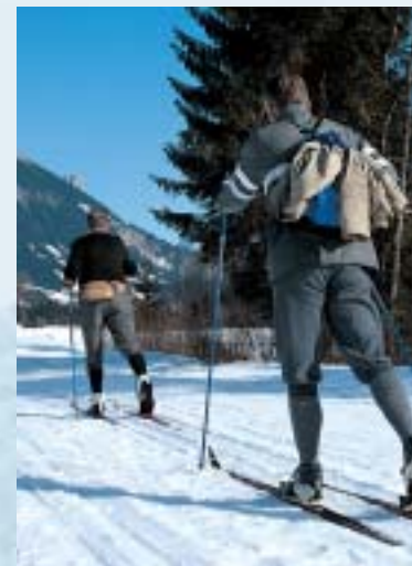
Langlauf-Loipe. La piste de fond. Cross-country trail.