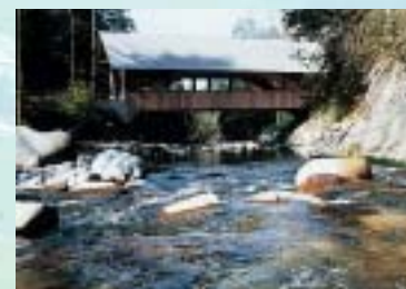
Holzbrücke über die Emme. Un pont en bois sur l'Emme. Wooden bridge over the Emme.

Schangnau (920 metres above sea-level) is a region of rolling hills overlooked by lofty peaks . Hohgant – known as the “crown of the Emmental” – is the highest of these peaks, rising to 2196 m. This unique landscape, unspoilt by through traffic, is a wonderful place to relax . The Emme river that flows through it is a paradise for swimming, fishing and canoeing. There are plenty of mountain-bike trails. More than 20 signposted hiking trails allow walkers to enjoy the varied flora and fauna or to admire the elaborately decorated farmhouses. In this area, craftsmen can still be seen at work making wagon wheels and roof shingles, for example. Picnic spots with barbecue facilities , some of them covered, are ideal for those warm summer days. If you prefer to eat in comfort, you can savour local specialities at five country inns distributed around the region. A full range of accommodation and catering establishments is available: hotels, restaurants, holiday flats and chalets, sleeping-bag accommodation at farms (“on the straw”) and year-round camping facilities.