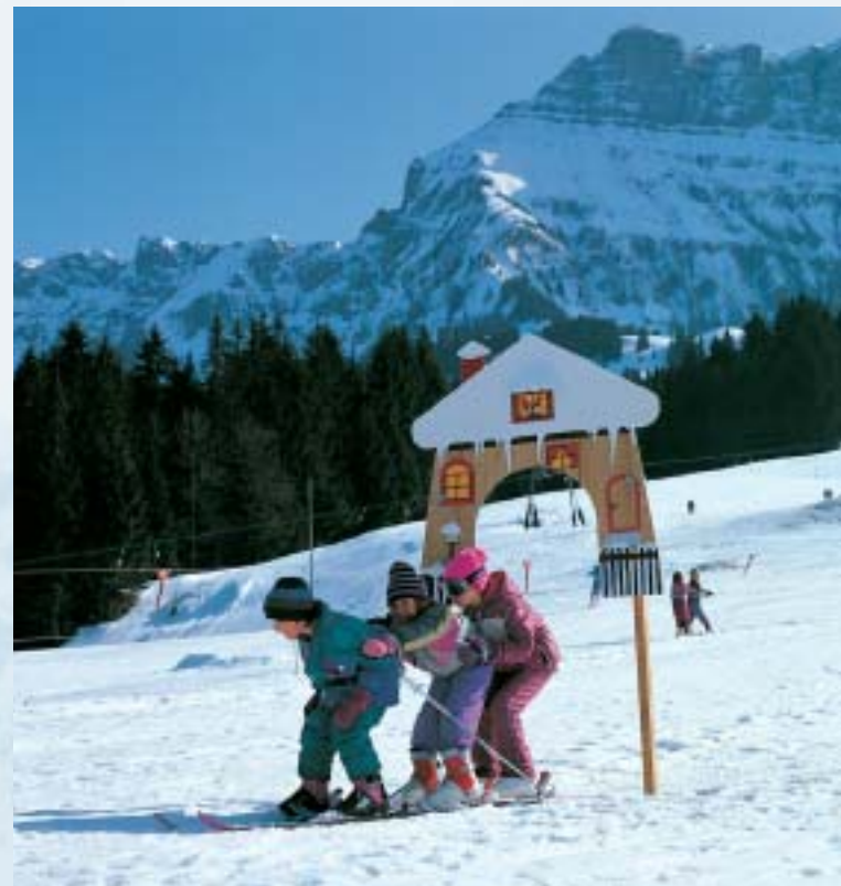
Kinderskiplausch. Des enfants ravis. Nursery slopes for the kids.

Skifahren , Langlaufen, Wandern und Verweilen: Die Region Schangnau – Bumbach – Kemmeriboden bietet im Winter vieles. Drei grosse Skilifte und ein Trainingslift erschliessen verschiedene Skigelände, die allen Ansprüchen gerecht werden. Die gut präparierten Pisten sind für Skifahrer und Snowboarder geeignet. Für Langläufer und Skiwanderer gibt es eine 10 km lange, gespurte und gepflegte Loipe entlang der Emme. Geniessen kann man nicht nur die wunderbare Umgebung. Die währschaften Gasthöfe laden ein zum Verweilen – zum Beispiel bei einer berühmten Meringue aus dem Schangnau. Auch für Verpflegung und Übernachtung lässt das Angebot keine Wünsche offen: Hotels, Restaurants , ganzjähriges Camping, Ferienwohnungen und -häuser bieten sich an.