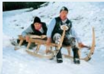
Hornschlittenrennen am Hohgant. Une course de luge à foin au Hohgant. "Hornschlitten" sledging on the Hohgant.