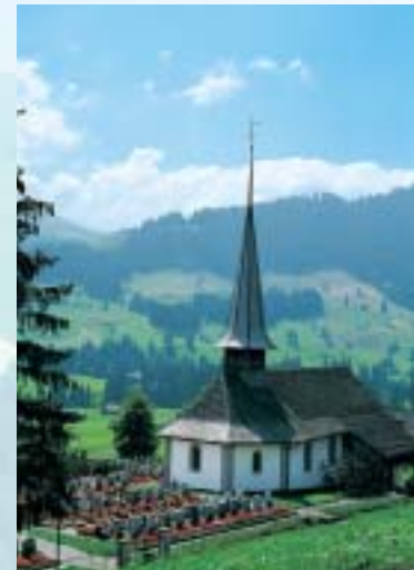
Die 1618 erbaute Kirche. L'église – elle date de 1618. The church, dating from 1618.