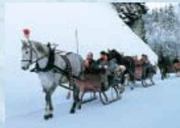
Schlittenfahrten. La descente en traîneau. Horse-sleigh rides.

Skifahren , Langlaufen, Wandern und Verweilen: Die Region Schangnau – Bumbach – Kemmeriboden bietet im Winter vieles. Drei grosse Skilifte und ein Trainingslift erschliessen verschiedene Skigelände, die allen Ansprüchen gerecht werden. Die gut präparierten Pisten sind für Skifahrer und Snowboarder geeignet. Für Langläufer und Skiwanderer gibt es eine 10 km lange, gespurte und gepflegte Loipe entlang der Emme. Geniessen kann man nicht nur die wunderbare Umgebung. Die währschaften Gasthöfe laden ein zum Verweilen – zum Beispiel bei einer berühmten Meringue aus dem Schangnau. Auch für Verpflegung und Übernachtung lässt das Angebot keine Wünsche offen: Hotels, Restaurants , ganzjähriges Camping, Ferienwohnungen und -häuser bieten sich an.