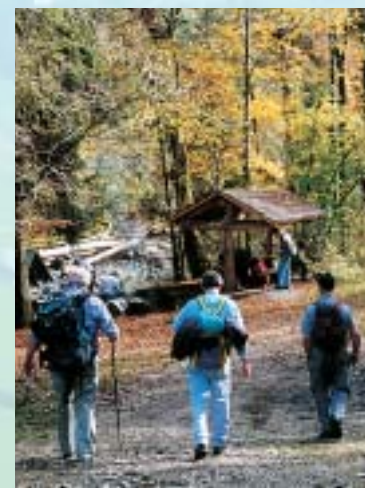
Feuerstellen mit gedecktem Sitzplatz. Une place de pique-nique couverte. Picnic spot with covered barbecue area.