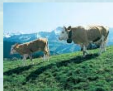
Kühe auf der Alp. Les vaches sur l'alpage. Cows grazing the Alpine pastures.